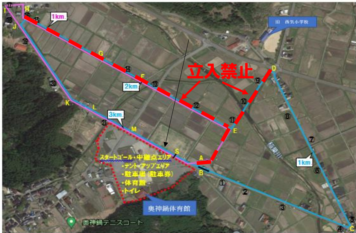
コースレイアウト